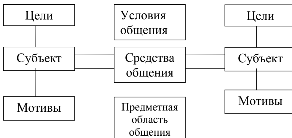
Рис. 4. Психологическая структура ситуации педагогического общения

Педагогическое общение как форма взаимодействия субъектов образовательного процесса. Структурной единицей педагогического общения является ситуация (рис. 4).