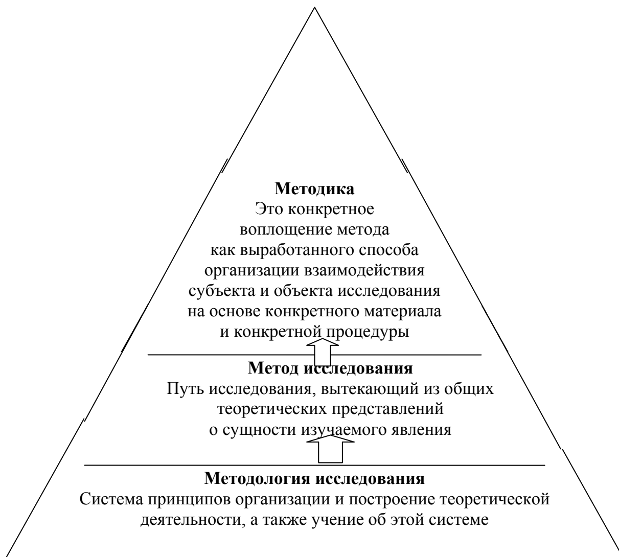
Рис. 1. Взаимосвязь методологии, методов и методик психолого-педагогического исследования

Метод наблюдения занимает в психолого-педагогических исследованиях особое место, иногда это единственно возможный метод изучения психических проявлений, например, в работе с детьми раннего возраста.