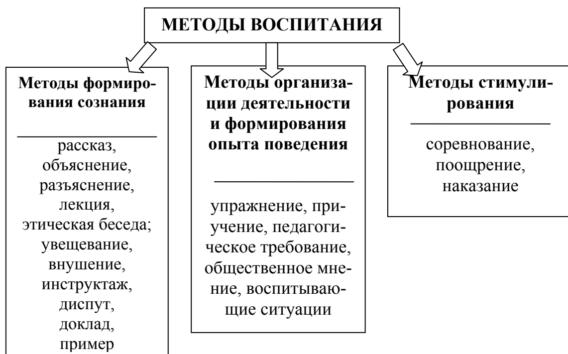
Рис. 2. Классификация методов воспитания

Одна из классификаций методов воспитания представлена в рисунке 2.